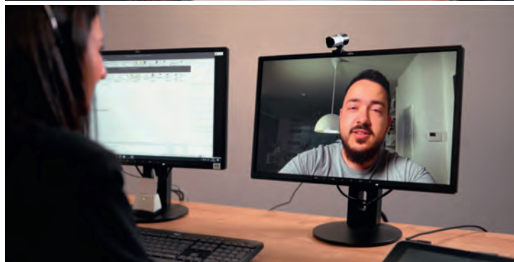
▲ Persönliche Beratung funktioniert auch im Videochat.

persönlichen Kontakt und die individuelle Beratung. Unsere Direktfiliale reiht sich damit als weiterer Erfolgsfaktor in unser vielseitiges Angebot ein. Wir sind nach wie vor mit einem breiten Geschäftsstellennetz und persönlicher Beratung vor Ort für unsere Kunden da, bieten gleichzeitig digitale Wege und werden dem veränderten Nutzungsverhalten von bereits mehr als 70 Prozent unserer Kunden durch ein ausgezeichnetes Online-Banking gerecht. Wir sind dort, wo unsere Kunden uns brauchen.